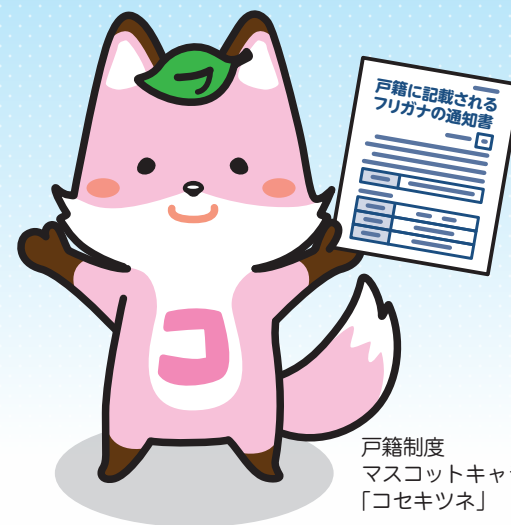
戸籍制度 マスコットキャラクター 「コセキツネ」